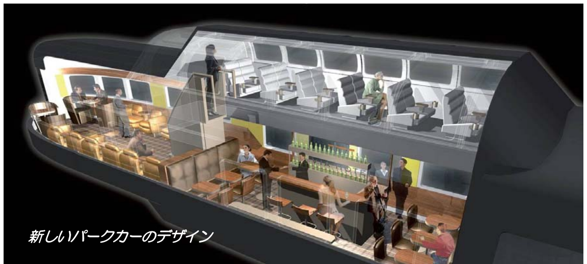
新しいパークカーのデザイン